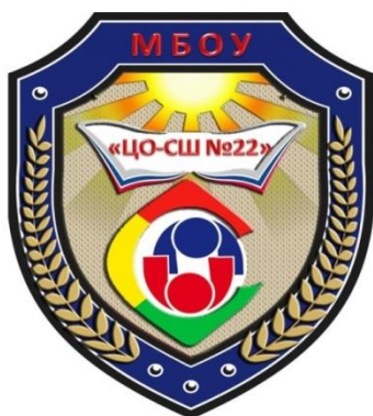
Рисунок 5. Эмблема МБОУ «ЦО – СШ №22»

Кредо педагогического коллектива МБОУ «ЦО – СШ №22»: «Центр образования – школа сильных знаний»: в учёбе, спорте и творчестве.